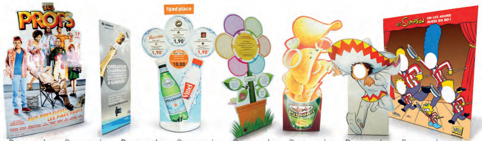
Pancarte Pancarte Pancarte Pancarte Pancarte