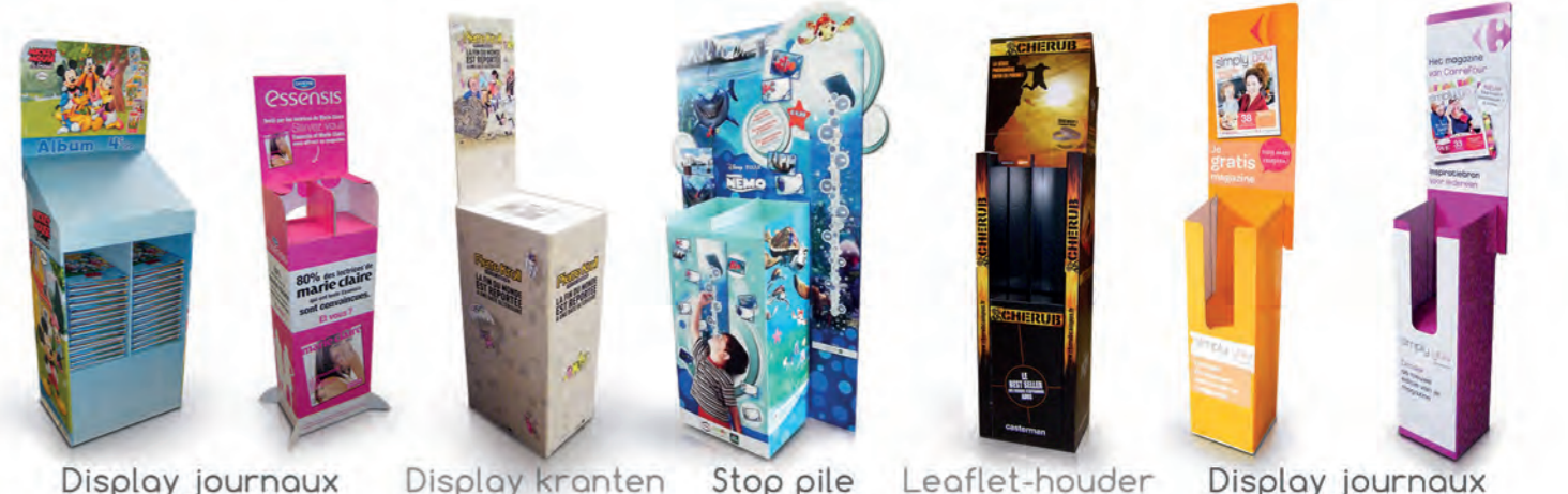
Display journaux Display kranten Stop pile Leaflet-houder Display journaux