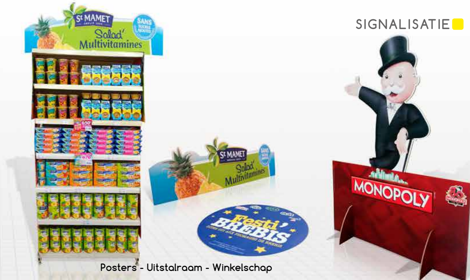
Posters - Uitstalraam - Winkelschap

Dankzij de rijkdom en de complementariteit van ons machinepark biedt de «Groep Trehout PLV» u een groot aantal producten om uw uitstalramen of winkelschappen aan te kleden of als aanduidingen in de winkel: