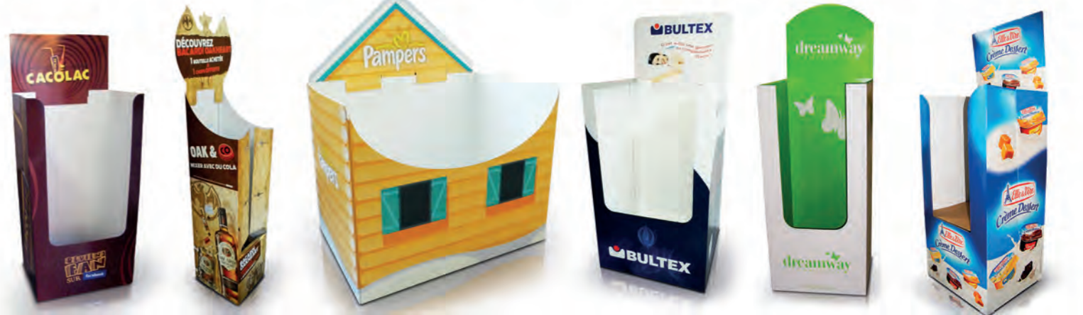
Box palette Palletdisplay Box palette Palletdisplay Box palette Palletdisplay