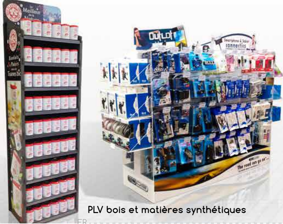
PLV bois et matières synthétiques