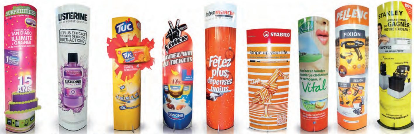
Totem Totem Totem Totem Totem Totem Totem Totem Totem Totem