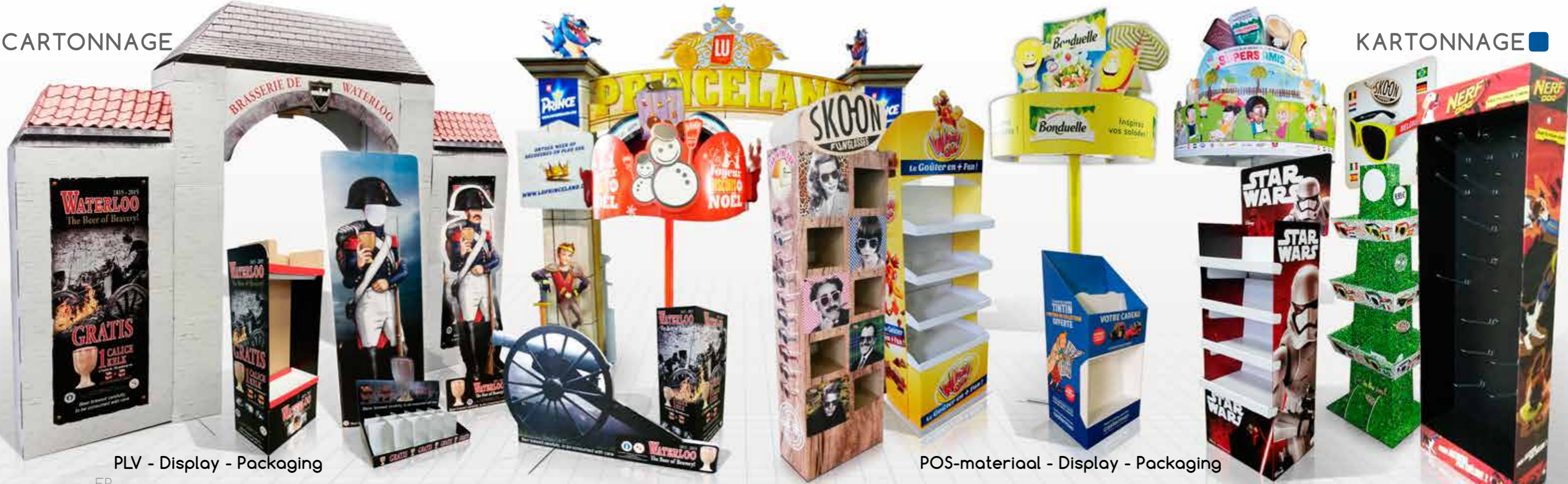
PLV - Display - Packaging