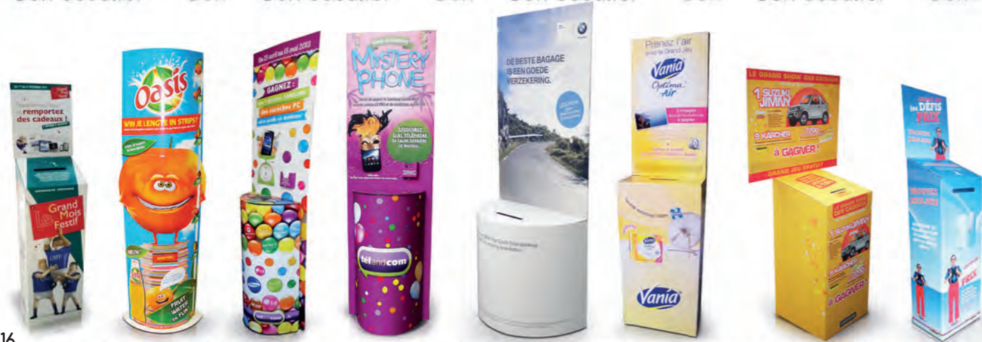
Urne de sol Vloerurne Urne de sol Vloerurne Urne de sol Vloerurne