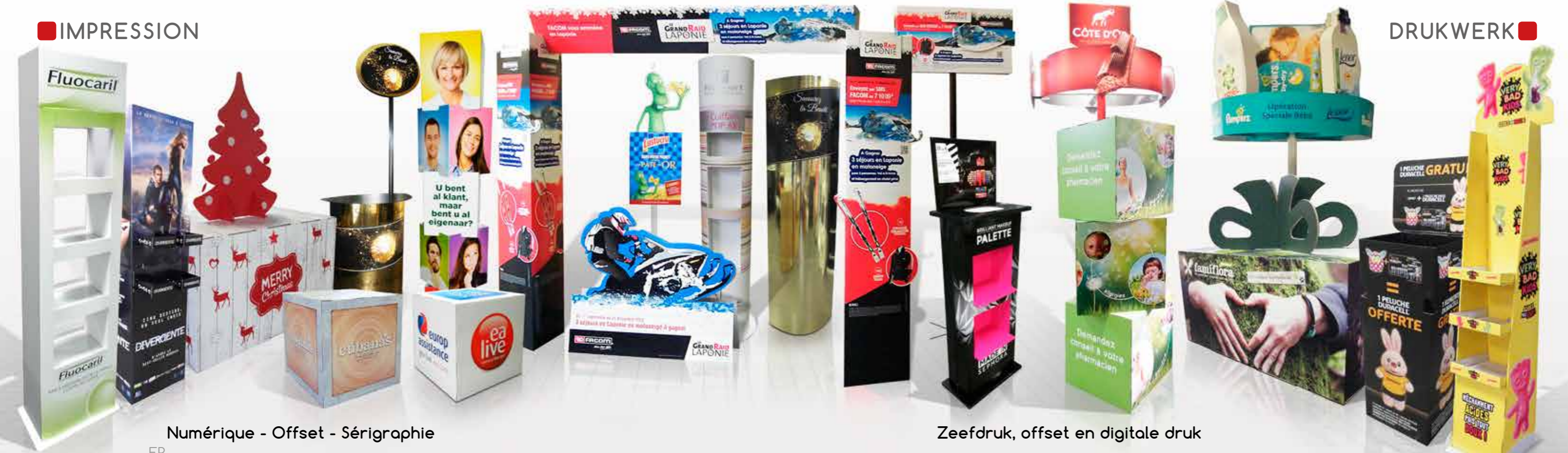
Numérique - Offset - Sérigraphie