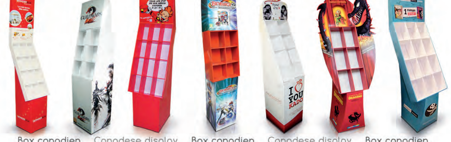
Box canadien Canadese display Box canadien Canadese display Box canadien