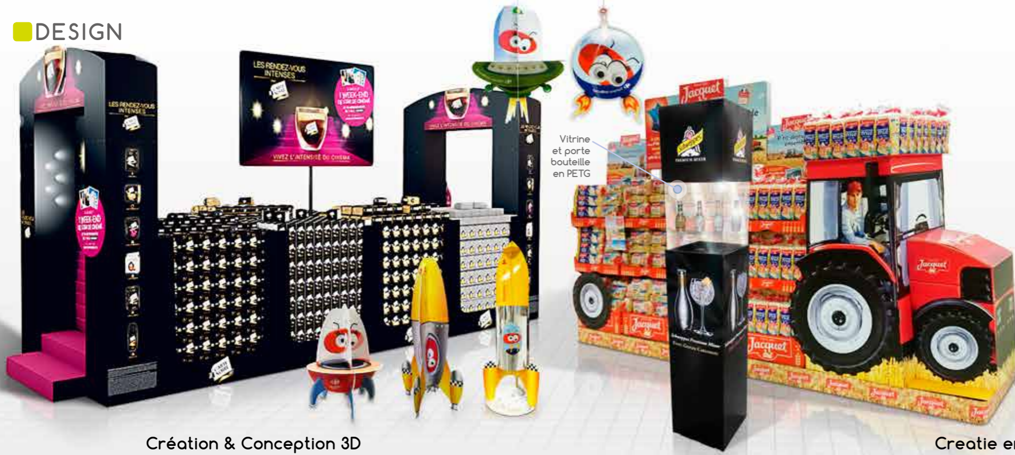
Création & Conception 3D