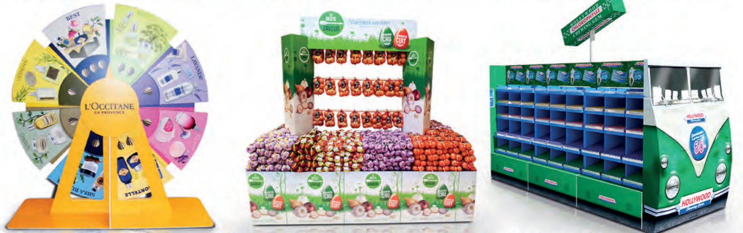
Théâtralisation In store theater Théâtralisation In store theater Théâtralisation