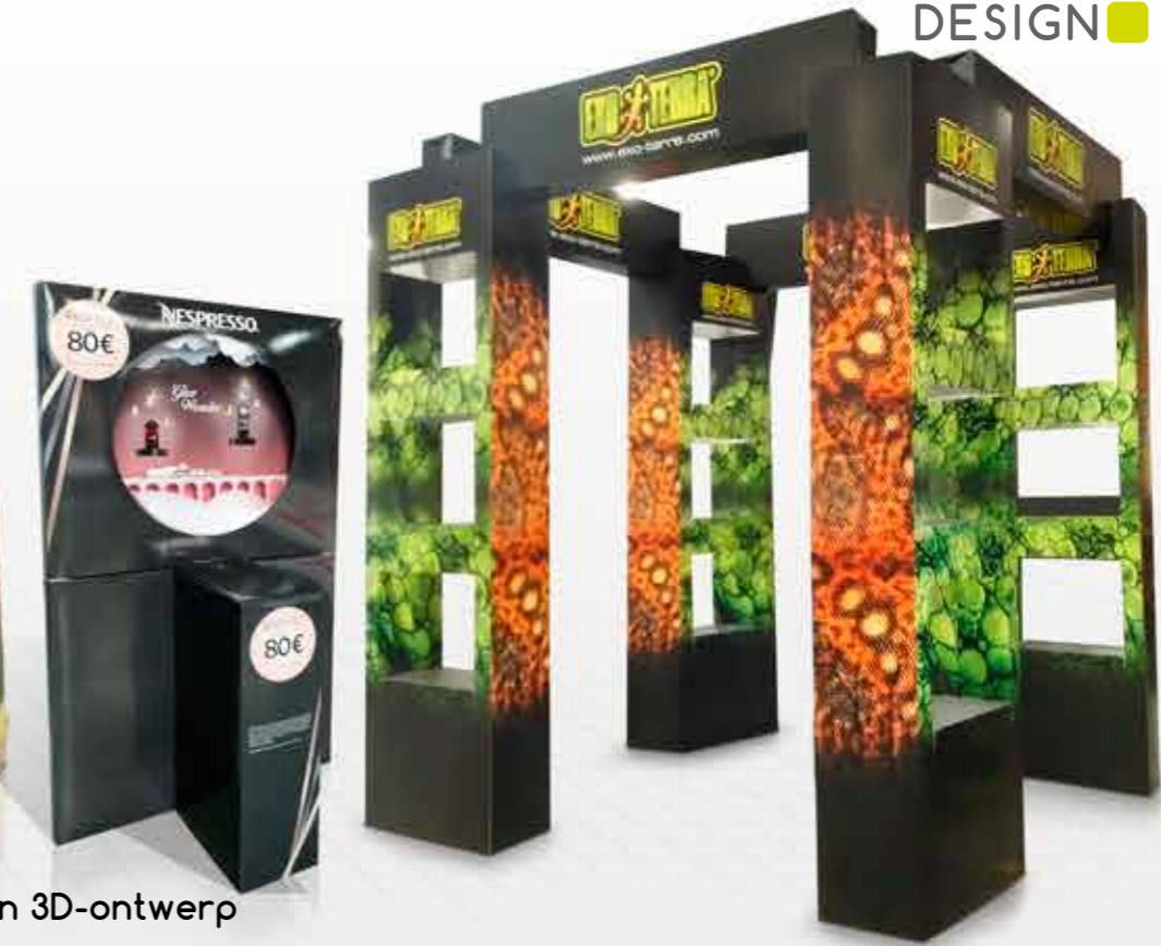
Creatie en 3D-ontwerp

Dit alles om zo goed mogelijk te voldoen aan uw behoeften.