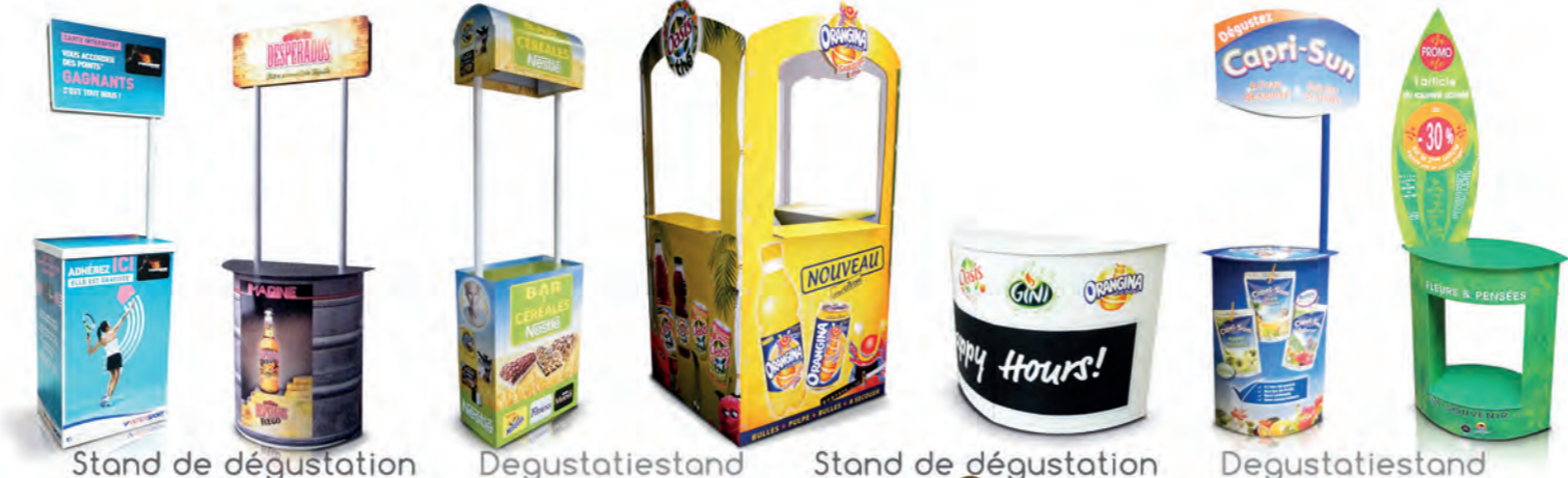
Stand de dégustation Degustatiestand Stand de dégustation Degustatiestand