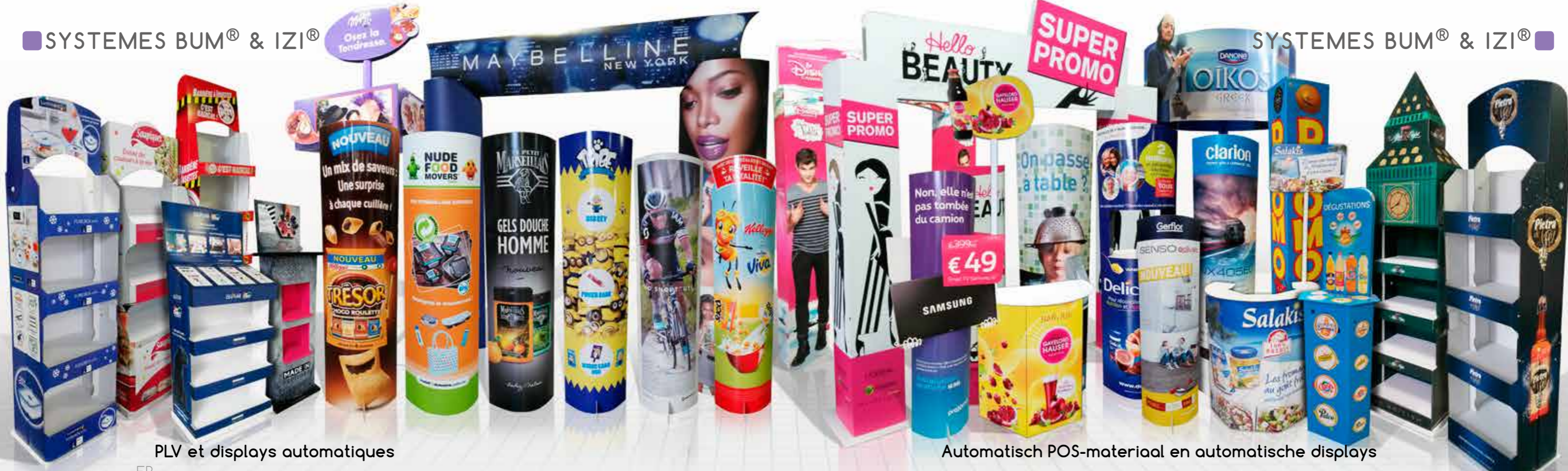
PLV et displays automatiques