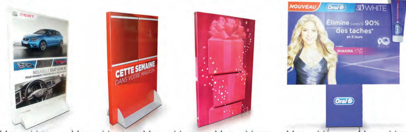
Mur Muur Mur Muur Mur Muur Muur