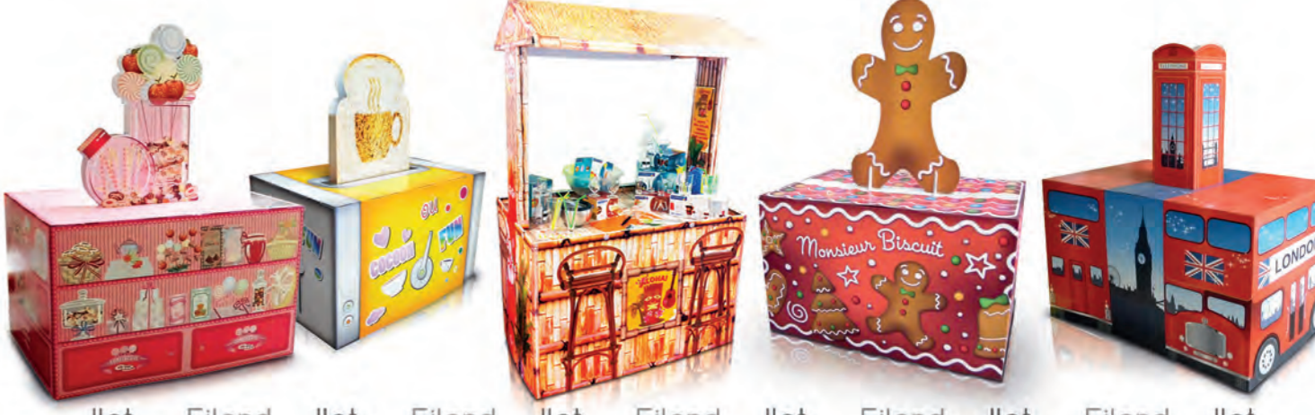
Ilot Eiland Ilot Eiland Ilot Eiland Ilot Eiland Ilot