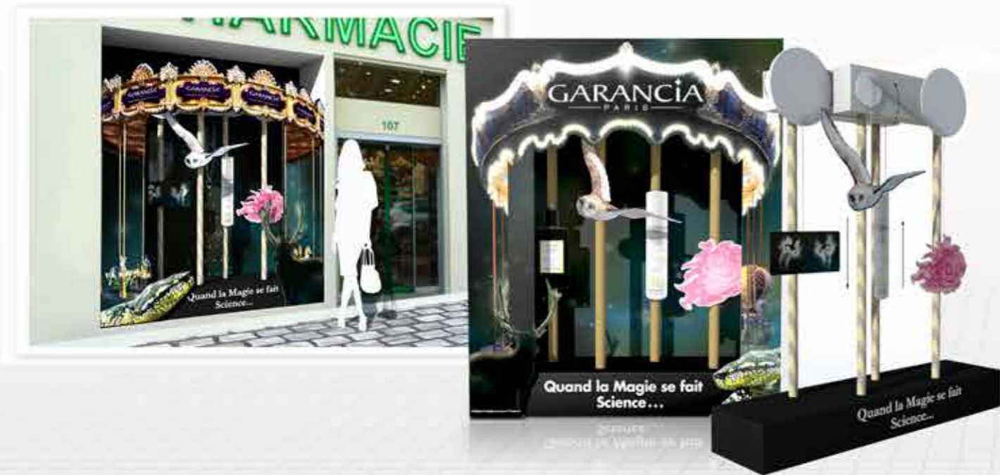
Affichage - vitrine - linéaire