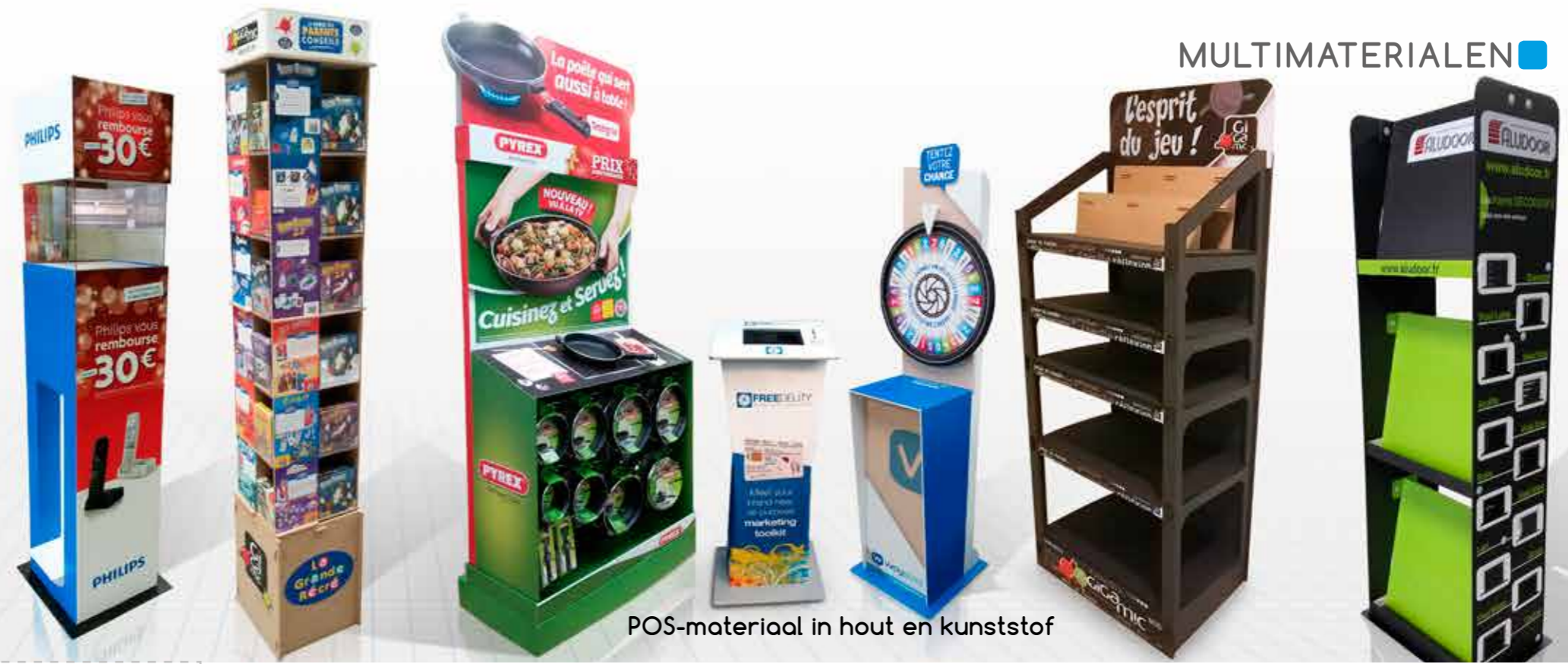
POS-matériau en bois et kunststof

Du display de comptoir au meuble à étagères, en passant par le display de sol, la PLV multi-matériaux peut répondre à tous vos besoins d'autant qu'il est possible, pour encore plus de visibilité, de lui adjoindre un dispositif d'éclairage, une motorisation ou un écran intégré.