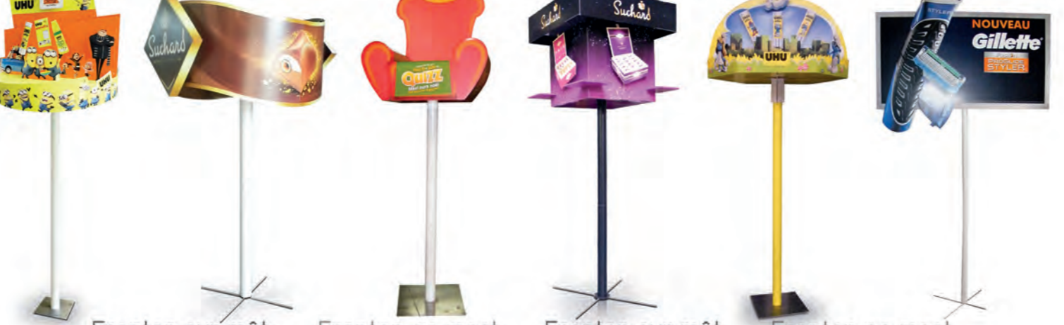
Fronton sur mât Fronton op mast Fronton sur mât Fronton op mast