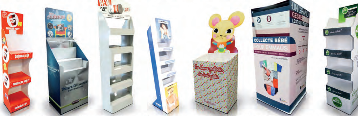
Display de sol Vloerdisplay Meuble Meubel Display de sol Vloerdisplay