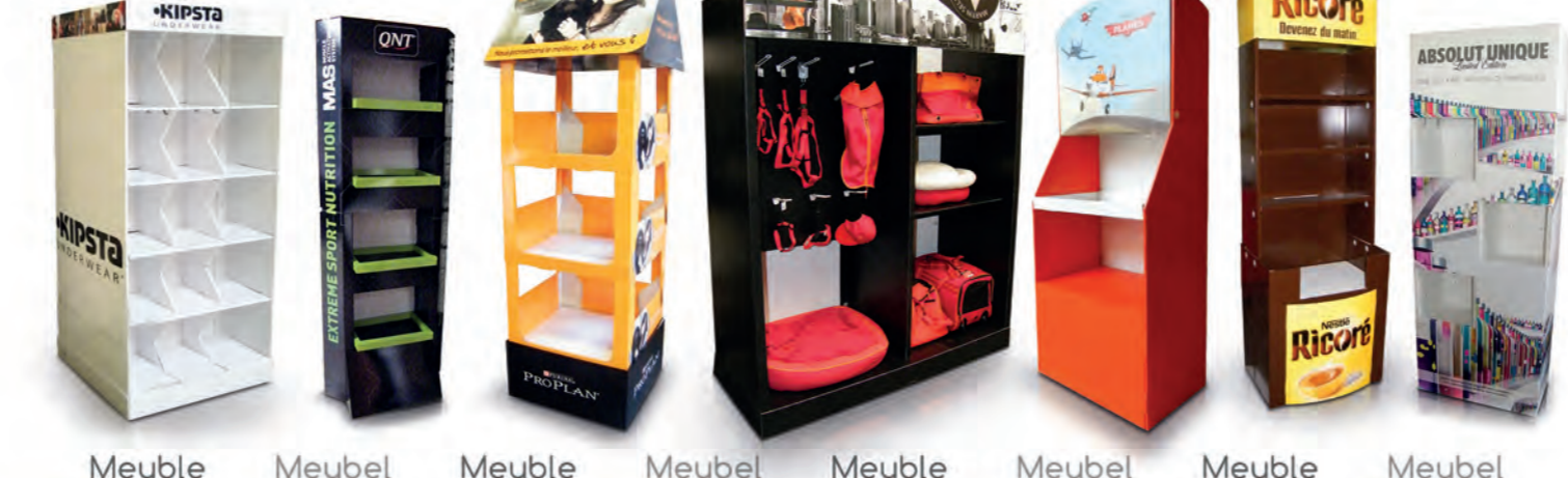
Meuble Meubel Meuble Meubel Meuble Meubel Meuble Meubel