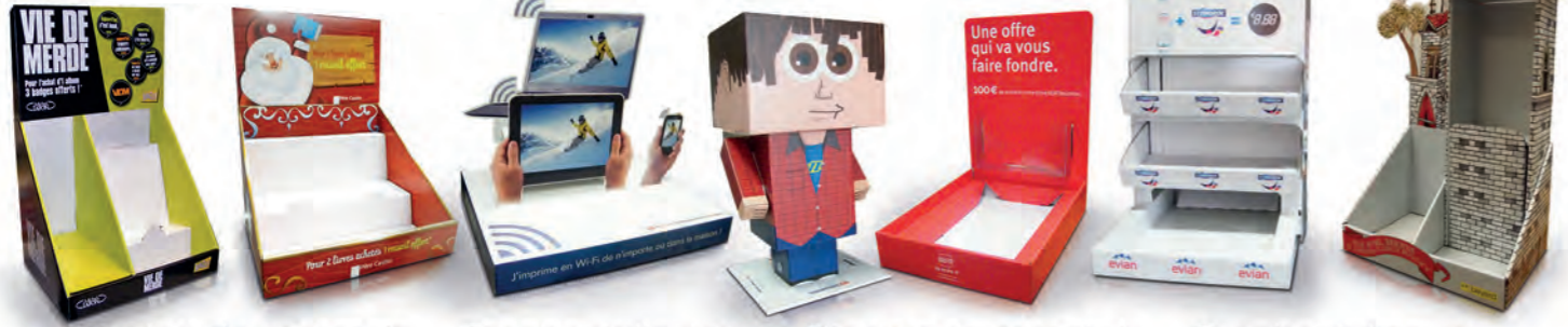
Display de comptoir Toonbankdisplay Display de comptoir Toonbankdisplay