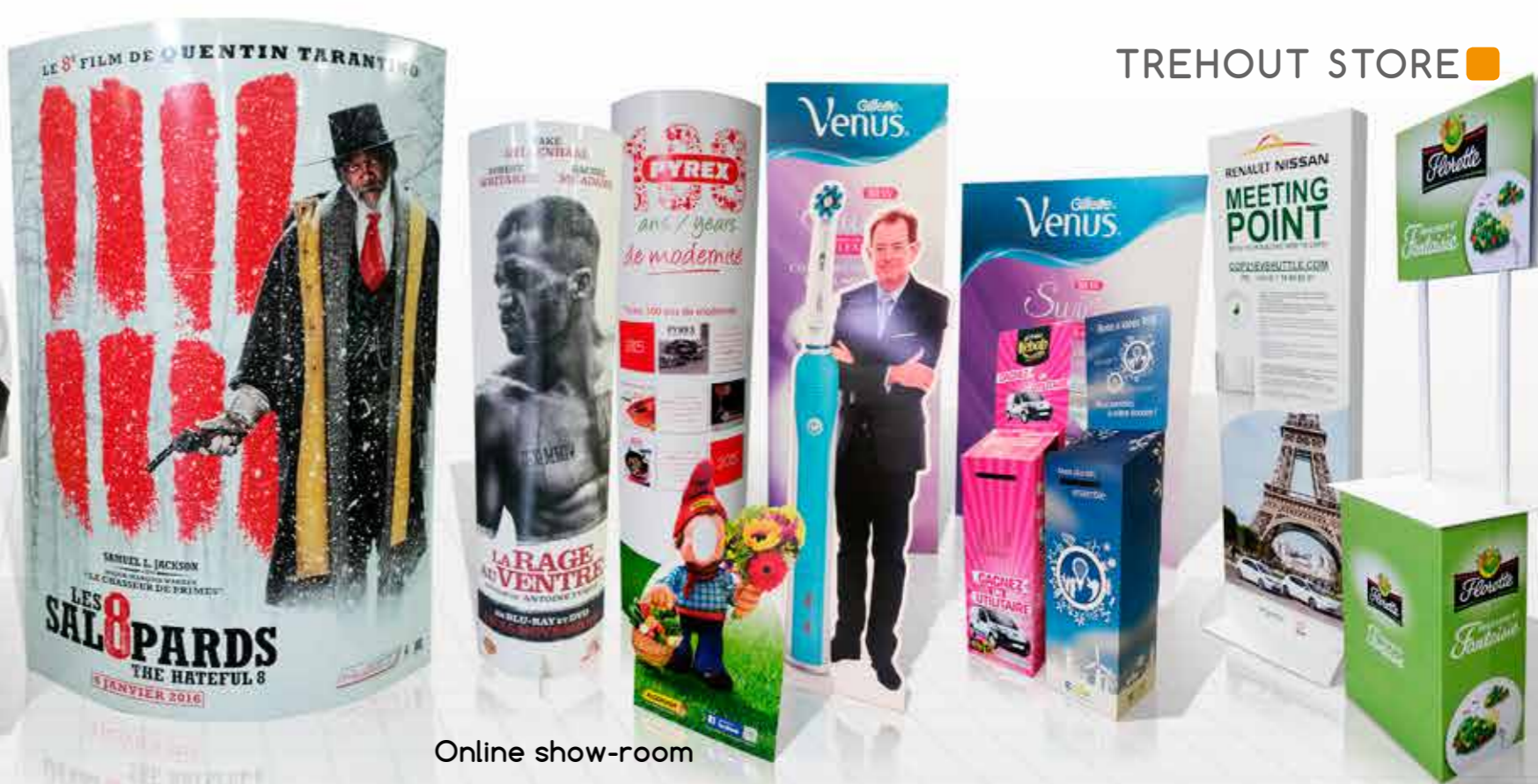
Catalogue de PLV en ligne